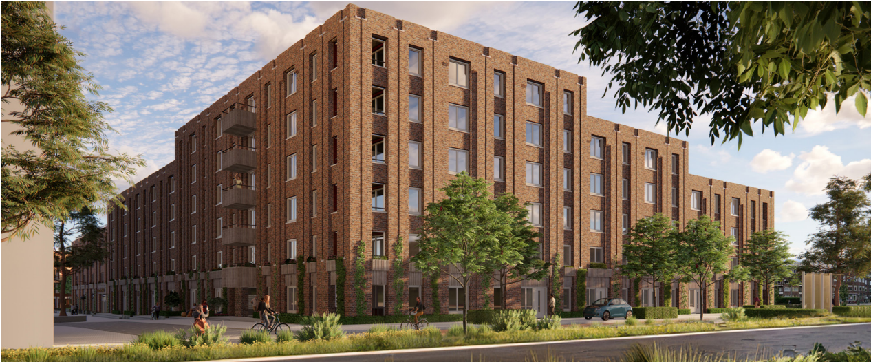
Impressie woongebouw Couchette 1A (aanzicht vanaf de Peizerbaan/spoorzijde)